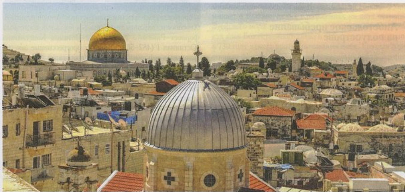
Храм Гроба Господня в Иерусалиме

святиющихся. А потом мы вышли из Гроба восточными дверьми и, войдя в алтарь, сотворили там целование с правоверными попами православными и сирийскими, и вышли из церкви и пошли в свой монастырь, и там отдохнули до литургии. И через три дня после Воскресения Господня, по литургии, пошли мы к ключнику Гроба Господня, и я сказал ему: «Хотел бы я взять свою лампаду». Он же с любовью принял меня, ввёл в Гроб одного только. И, войдя в Гроб, увидел я свою лампаду, стоящую на Святом Гробе и ещё горящую светом тем святым. И поклонился я тому Святому Гробу и облобызал место то честное, где лежало пречистое тело Господа нашего Иисуса Христа. И тогда я сам измерил Гроб в длину, ширину и высоту, каков он; при людях ведь невозможно измерить его никому. И я почтил Гроб Господень по силе моей, как мог, и тому ключнику подал немного на благословение. Он же, видя мою любовь ко Гробу Господню, отодвинул тогда дощечку, находящуюся в головах святого Гроба Господня, и отломил мне от того святого камня небольшую частицу на благословение, запретив мне с клятвой кому-либо говорить об этом в Иерусалиме. Я же поклонился Гробу Господню и ключнику и, взяв лампаду свою с маслом ещё горящим, вышел из Гроба Святого с радостью великою, обогатясь благодатью Божией, неся в руке моей дар святого места и знамение Святого Гроба Господня, и шёл, радуясь, как будто сокровище обрёл. И пошёл в келью свою с радостью великою.